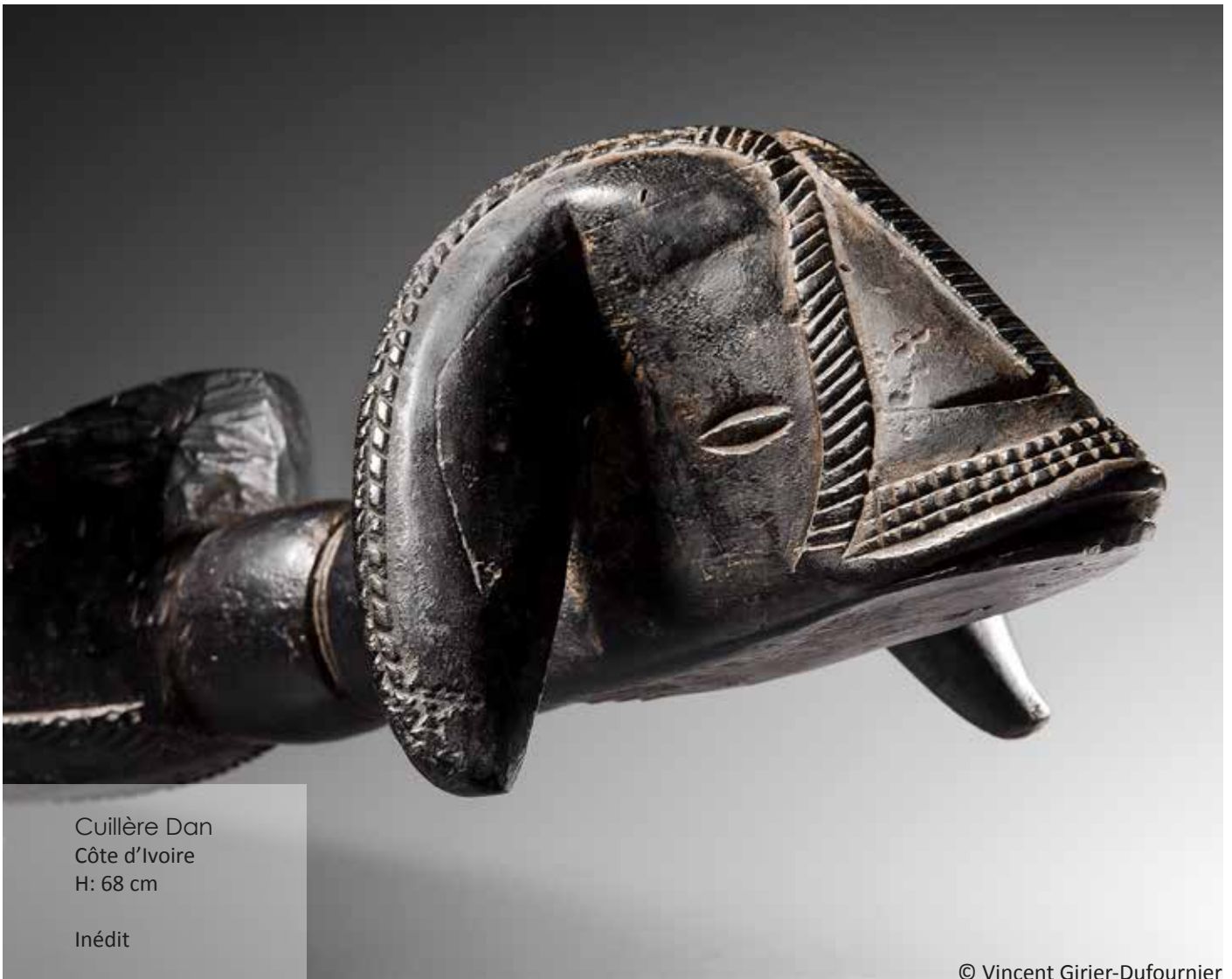
Cuillère Dan Côte d'Ivoire H: 68 cm