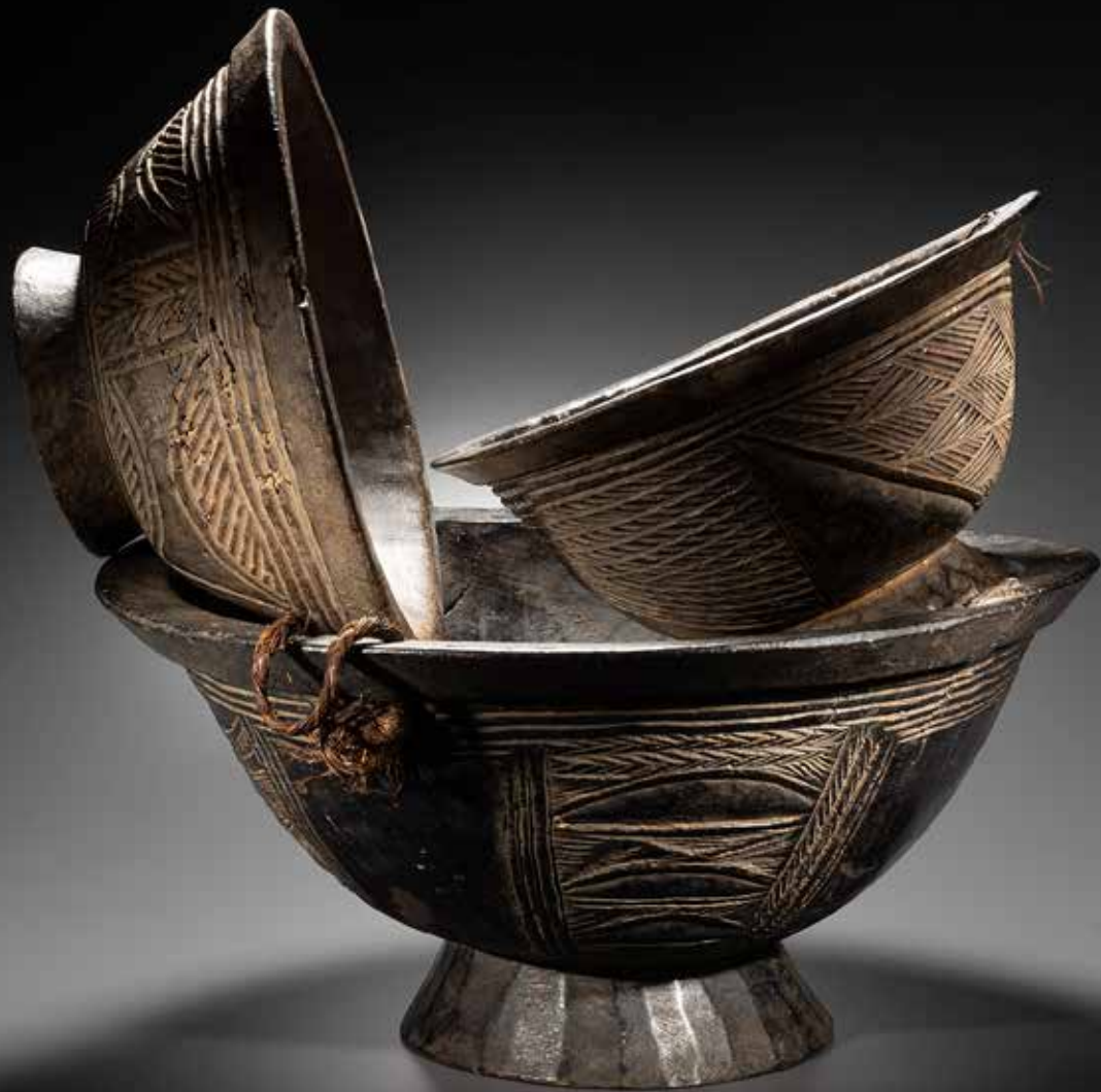
Bols Dan Côte d'Ivoire D: 28,5, 30, 43 cm