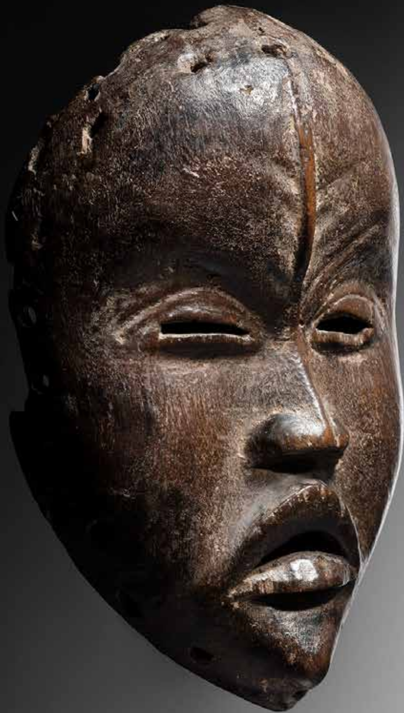
Masque Dan Côte d'Ivoire H: 23 cm