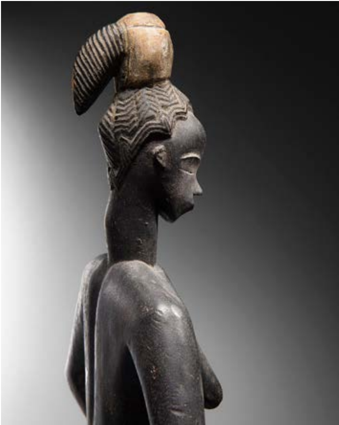
Statue Gouro, par le Maître de Bouaflé, 47 cm. Offerte à un musée américain en 1945