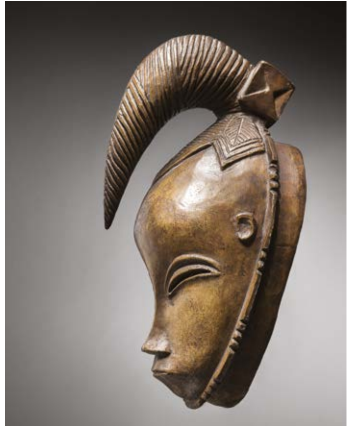
Masque en terre cuite. Travail français à partir d' un masque Gouro du Maître de Bouaflé, 34 cm., circa 1930